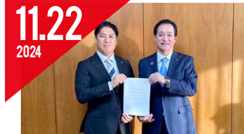
政策・制度要求実現の取組み (連合南多摩地区協)