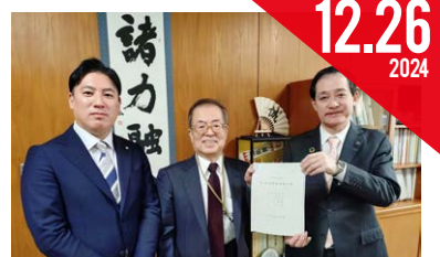
令和6年度 第1回定期 監査報告書(市長提出)