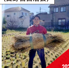
藁集め (日野台自治会)