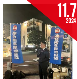
街頭宣伝行動 (連合南多摩地区協)