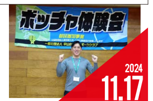
ボッチャ体験会 (一般社団法人平山台文化スポーツクラブ)