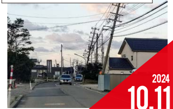
能登半島地震等による被災状況視察(内灘町ほか)