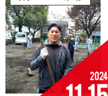
砂入れ (緑ヶ丘公園)