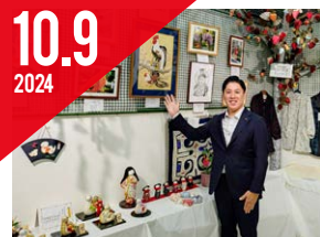
高齢者作品展 (日野市老人クラブ連合会)