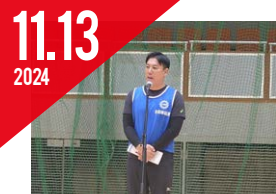
ナイスハートふれあいの スポーツ広場(自動車総連)