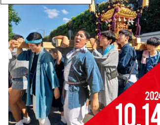
秋まつり (緑ヶ丘自治会)