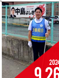
ゴミ拾い& カーブミラー清掃