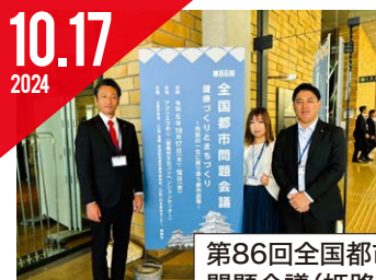
第86回全国都市問題会議(姫路市)