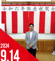
敬老祝賀会 (緑ヶ丘玄風会)