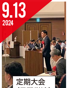
定期大会 (日野労連)