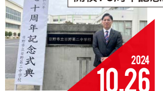
日野第二中学校 開校70周年記念式典