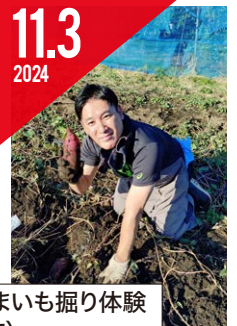
さつまいも掘り体験 (新町)