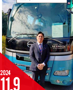
第58回日野市産業まつり