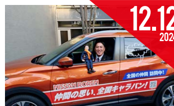
全国キャラバン (いそざき哲史参議院議員)