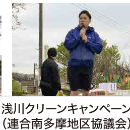
浅川クリーンキャンペーン (連合南多摩地区協議会)