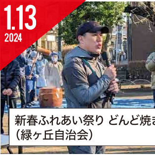
新春ふれあい祭り だんご焼き (緑ヶ丘自治会)