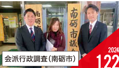
会派行政調査(南砺市)