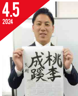
第36回 日野書道連盟会員展