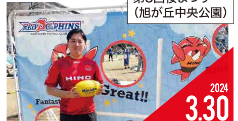
第3回桜まつり (旭が丘中央公園)