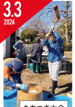
もちつき大会 (暁自治会)