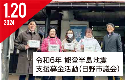
令和6年 能登半島地震 支援募金活動(日野市議会)