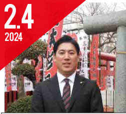
日野台三本杉稻荷神社 初午祭