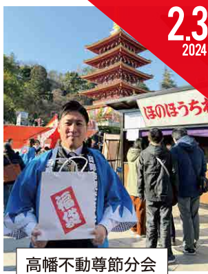
高幡不動尊節分会