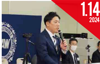
日野労連 第76回中央委員会(宇都宮市)