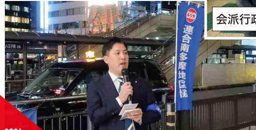
春闘駅頭行動 in 八王子駅北口 (連合南多摩地区協議会)