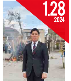
だんご焼き (日野台自治会)