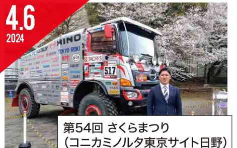
第54回 さくらまつり (コニカミノルタ東京サイト日野)