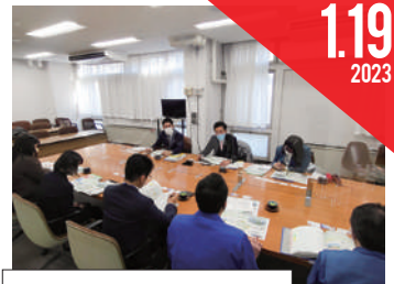
行政調査:ゼロカーボン ベースボールパーク 整備計画(尼崎市)