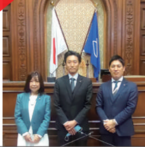
行政調査:内部統制(静岡市)