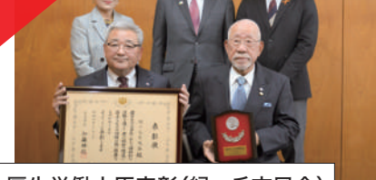
厚生労働大臣表彰(緑ヶ丘玄風会)