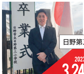
日野第三小学校 卒業式