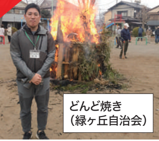
どんど焼き (緑ヶ丘自治会)