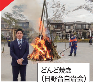
どんど焼き (日野台自治会)